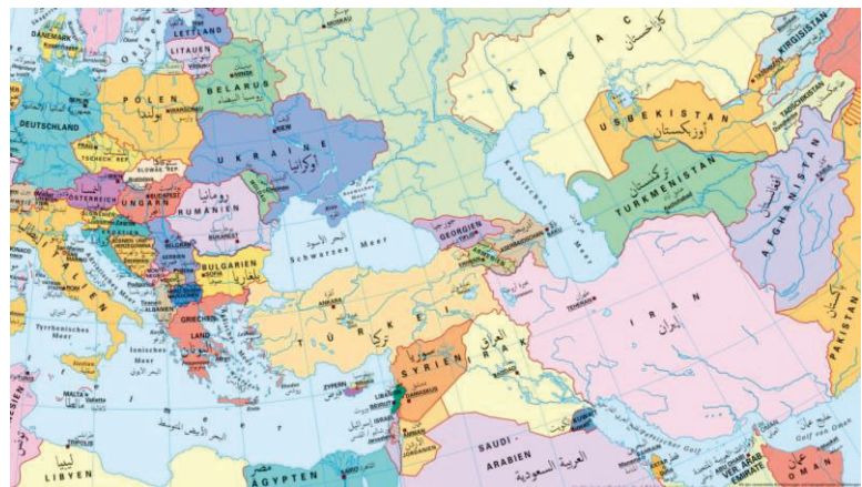
Abb. 14: Karte „Europa und seine Nachbarn, politisch, deutsch/arabisch“ (Detailausschnitt)

Eine Vielzahl solcher Keramiken stammt aus der Zeit der Samaniden . Die Samaniden waren ein Herrscherhaus, eine Dynastie, die vom neunten bis ins elfte Jahrhundert in Zentralasien und Teilen des heutigen Irans herrschte.