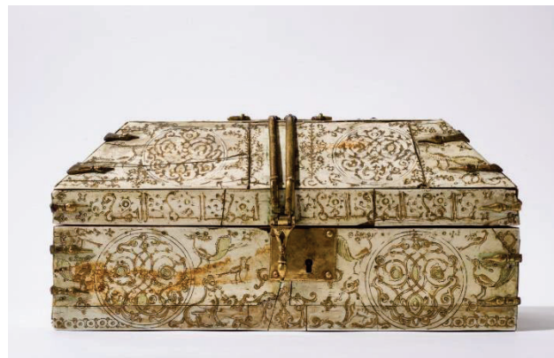
Abb. 19: Behältnis aus Elfenbein mit kalligrafischem Element