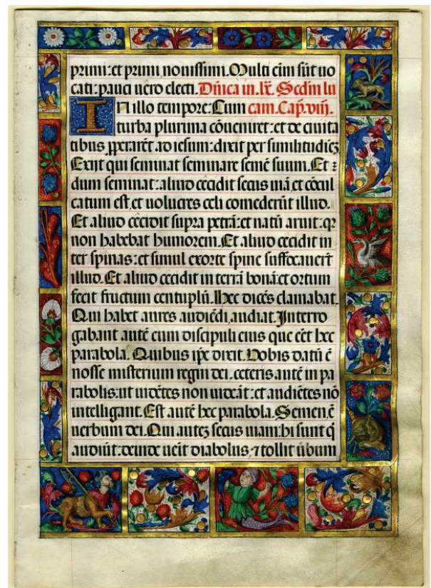
Abb. 22: Buchkunst