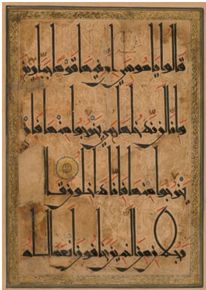
Abb. 15: Blatt einer Handschrift (Koran)