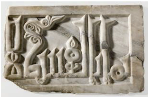
Abb. 18: Kufi-Duktus (Form der arabischen Kalligrafie) in Stein