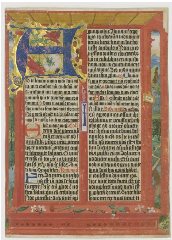
Abb. 21: Buchkunst