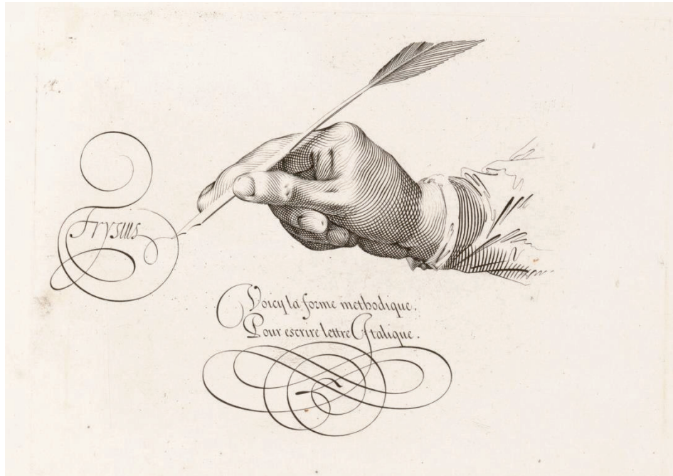
Abb. 20: Schriftkunst