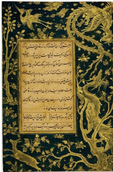
Abb. 16: Persische Dichtung