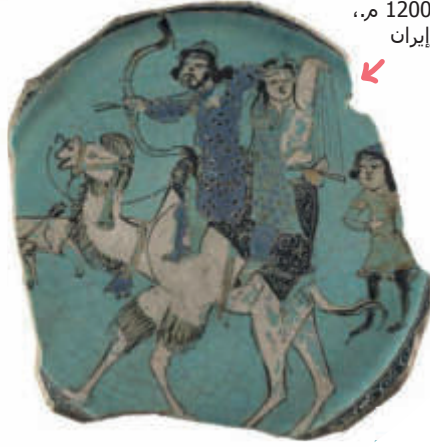
الشكل 26: قاعدة إناء، حوالي 1200 م، قاشان/إيران