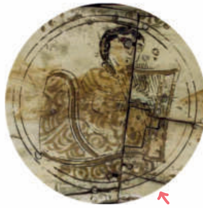
الشكل 19: علبة من العاج، القرن 12 م، صقلية

عُزفت الموسيقى في جميع العصور. الموسيقى ترافق البشر. فهي تساعد على التعبير عن المشاعر، ويمكنها أيضاً خلق المشاعر، أو على الأقل مصاحبته. غالباً ما يتم عزف الموسيقى أو تشغيلها في الاحتفالات. لذلك ليس من المستغرب أن يتم تصوير الموسيقيين عبر التاريخ.