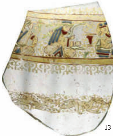
الشكل 20: كسرة زجاجية، القرن 13 م، سورية