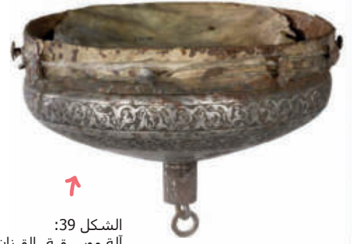
الشكل 39: آلة موسيقية، القرنان 18، 17 م، تركيا