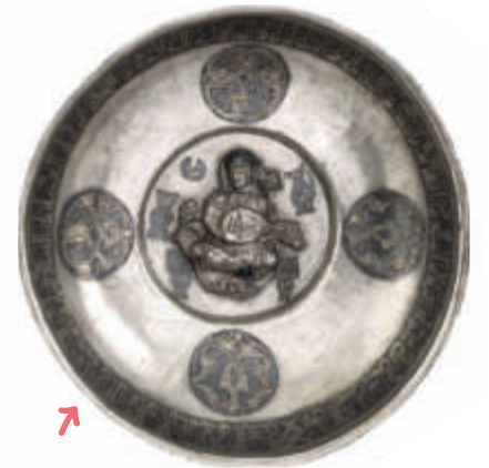
الشكل 42: طبق فضي، القرن 11، إيران