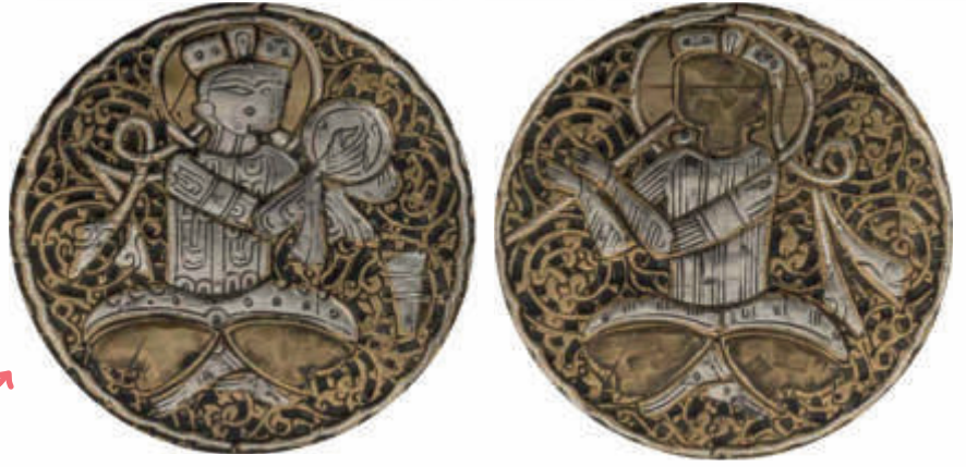
الشكلان 43/44: تفاصيل من حوض معدني، 1275.1251 م، الموصل/العراق