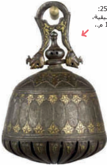
الشكل 25: آلة موسيقية، القرن 16 م، إيران