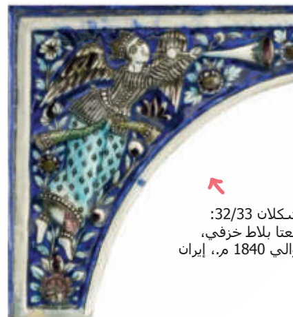
الشكلان 32/33: قطعتا بلاط خزفي، حوالي 1840 م، إيران