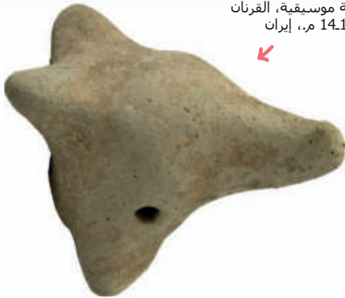
الشكل 31: آلة موسيقية، القرنان 14.13 م، إيران