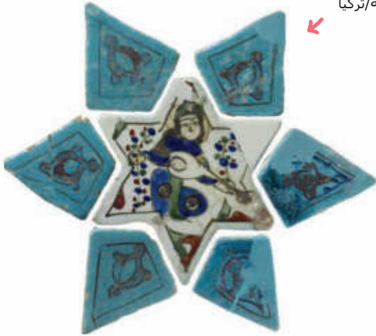
الشكل 28: بلاطة خزفية نجمية الشكل، القرن 13 م، قونية/تركيا