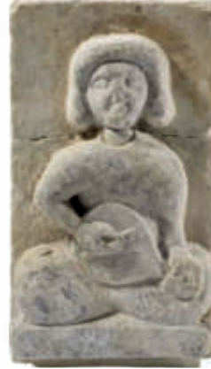
الشكل 38: نحت نافر، القرن 13 م، تركيا