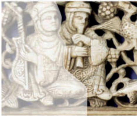
الشكلان 40/41: لوحان من العاج، القرنان 12، 11 م، صقلية