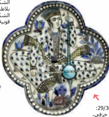
الشكلان 29/30: قطعتا بلاط خزفي، حوالي 1840 م، إيران