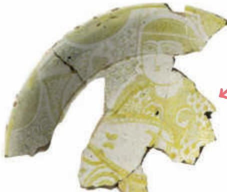
الشكلان 23/24: أجزاء من طبق، القرن 11 م، الفسطاط/مصر