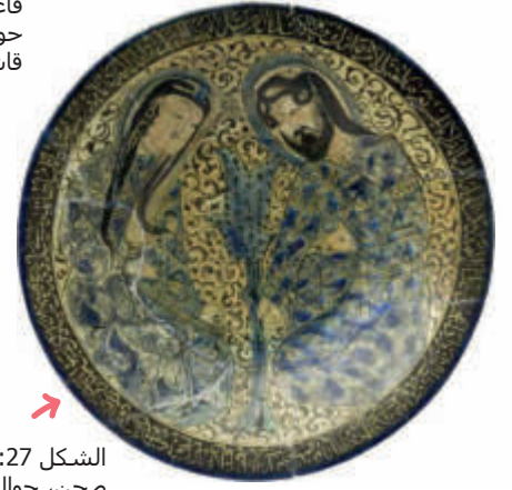
الشكل 27: صحن، حوالي 1300 م، إيران