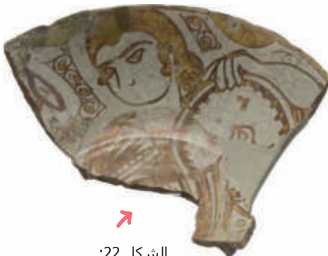
الشكل 22: جزء من طبق، القرن 11 م، الفسطاط/مصر