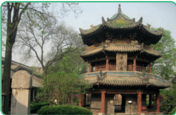
China: Große Moschee von Xi'an [Abb.14]

Die Moschee ist ein Lehm- und Ziegelsbau. Seit seinem Baubeginn im 13. Jahrhundert n. Chr. ist sie immer wieder verändert worden. Lehm muss immer wieder neu aufgetragen werden, um das Bauwerk zu erhalten. Der Bau gilt als beispielhaft für die Moscheen in Westafrika.