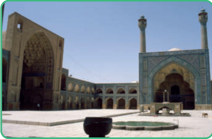
Iran: Große Moschee von Isfahan [Abb.12]

Die große Moschee von Isfahan, Baubeginn 479/1086-87, wurde zum Vorbild für die iranischen Moscheen. Sie tritt durch ihre Kuppel, ihre Fensterlosigkeit und ihre vier bogenförmige Eingänge – die Iwane – hervor.