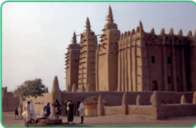
Mali: Große Moschee von Djenné [Abb.13]

Die große Moschee von Isfahan, Baubeginn 479/1086-87, wurde zum Vorbild für die iranischen Moscheen. Sie tritt durch ihre Kuppel, ihre Fensterlosigkeit und ihre vier bogenförmige Eingänge – die Iwane – hervor.