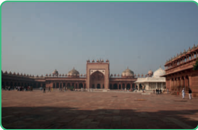
Indien: Große Moschee von Fatehpur Sikri [Abb.17]

Mimar Sinan plante den Süleymaniye-Komplex 957/1550. Die Moschee ist ein Kuppelbau nach dem Vorbild der Hagia Sophia. Seitlich befinden sich noch zwei Halbkuppeln. Umrahmt wird die Moschee von den Bleistiftminaretten.