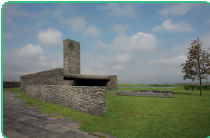
Türkei: Sancaklar-Moschee [Abb.18]

Erbaut wurde die Moschee 975/1568 – 986/1578 aus rotem Sandstein mit Einlegearbeiten aus weißem Marmor. Das wurde stilbildend, wie auch der erbaute Innenhof.