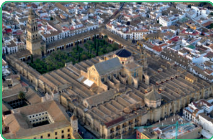
Spanien: Cordoba [Abb. 10]

Die große Moschee von Damaskus wurde 90/709 – 96/715 erbaut. Sie wurde prunkvoll mit Marmorverkleidungen, Mosaiken und Stuckgittern ausgeschmückt. Ihre Form zeichnet sich durch eine Säulenhalle als Gebetssaal aus, vor dem ein Hof mit umlaufenden Arkaden liegt. Dieser Stil weist viele Verbindungen zur Kirchenarchitektur auf.