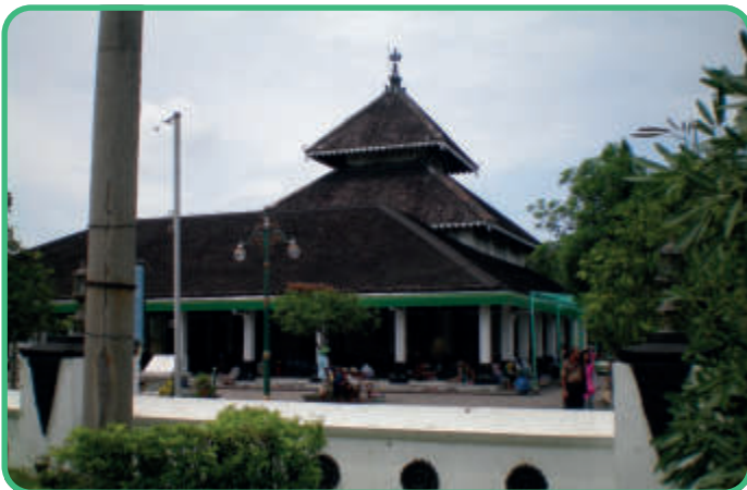
Indonesien: Agung-Moschee in Demak [Abb.15]

Der Bau der Moschee wurde 794/1392 begonnen. Seine Form lehnt sich an die lokale Architektursprache an.