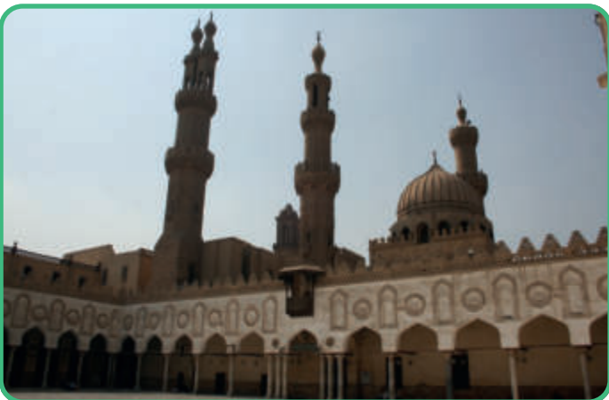
Ägypten: Al-Azhar [Abb. 11]

In der großen Moschee von Cordoba wurde der Typ der Säulenhalle weiterentwickelt. Die Säulenreihen haben einzelne Dächer, so dass der Raum lichtdurchflutet ist. Nach der Vertreibung der Muslime und Musliminnen aus Südspanien wurde in die Moschee 929/1523 eine christliche Kathedrale gebaut.