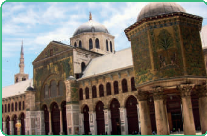
Syrien: Damaskus [Abb. 9]

Wie unterschiedlich Moscheen aussehen können, kannst Du hier an einigen Beispielen sehen: